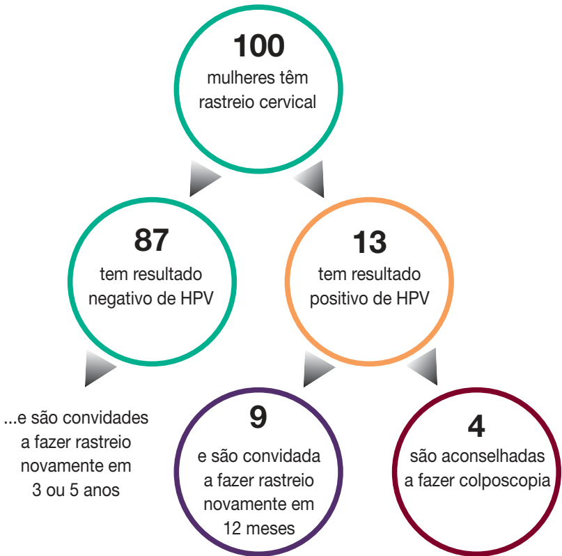
Diagrama mostrando os resultados de cada 100 pessoas que fizeram exame cervical